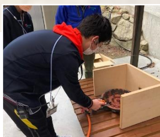
プロパンガスで湯沸かし