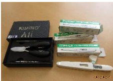
匿名 体温計・爪切りニッパー