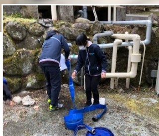
ホースを繋いで給水

暗闇の中での避難にも、皆さん落ち着いて参加できました。定期的の実施し、利用者さん・職員共に冷静かつ迅速な行動がとれるよう、訓練していきたいと思えます。