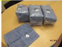
野村作(株)様より フェイスタオル