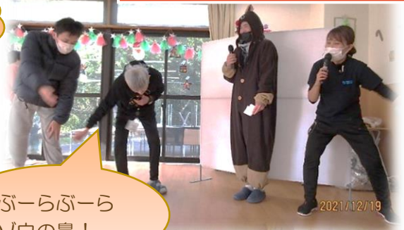
ぶーらぶーら ゾウの鼻!