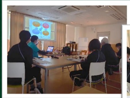
リスクマネジメント研修