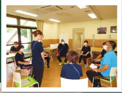
コミュニケーション研修