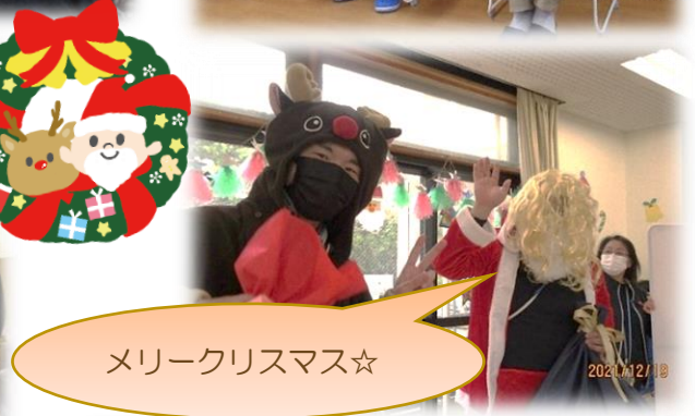
メリークリスマス☆