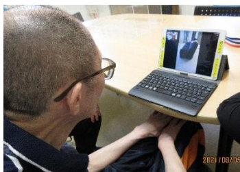
LINE でのビデオ通話の様子

ご来園が難しい方、感染リスクがご心配な方等、Zoom や LINE のビデオ通話による面会も受け付けておりますので、お問い合わせください。