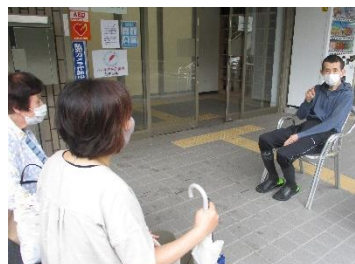
個別での随時面会の様子