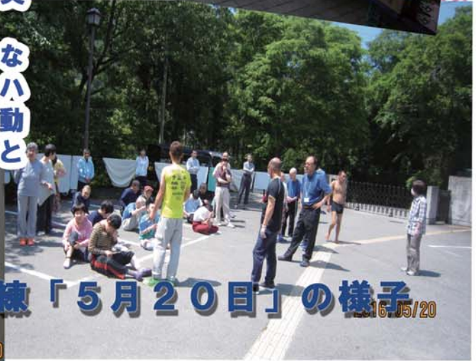
避難訓練「5月20日」の様子 2016/05/20