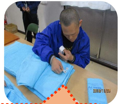
よし、このへんかな・・・