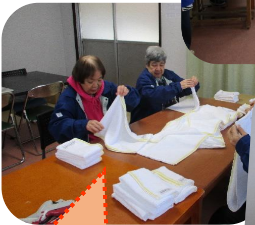
タオルたたみ作業！皆さん器用です！