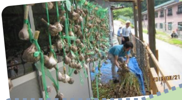
昨年のにんにくの収穫から！