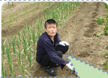
みんなも手伝ってよ・・・！