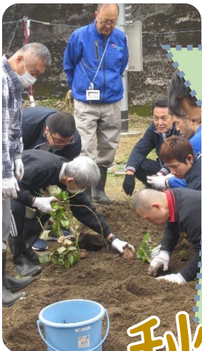
さつまいも、あるかな・・・？