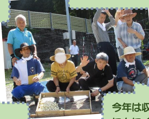
今年は収穫したにんにくを植えます！ にんにくの舞い??