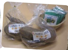
豊能町特産品のヤーコン たくさん摂れました！ 葉はお茶にしています。